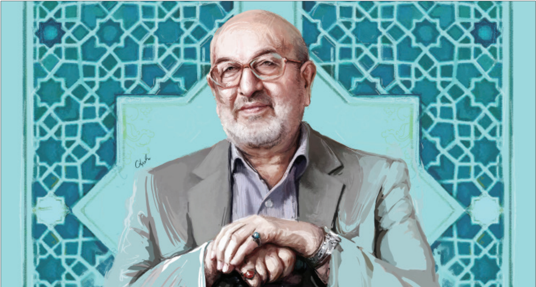
طرح: آرتوس عارفی