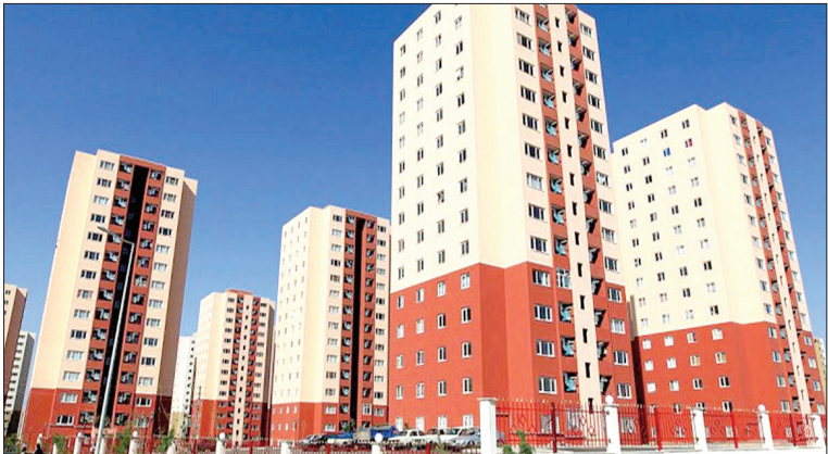
سخنگوی دولت اعلام کرد