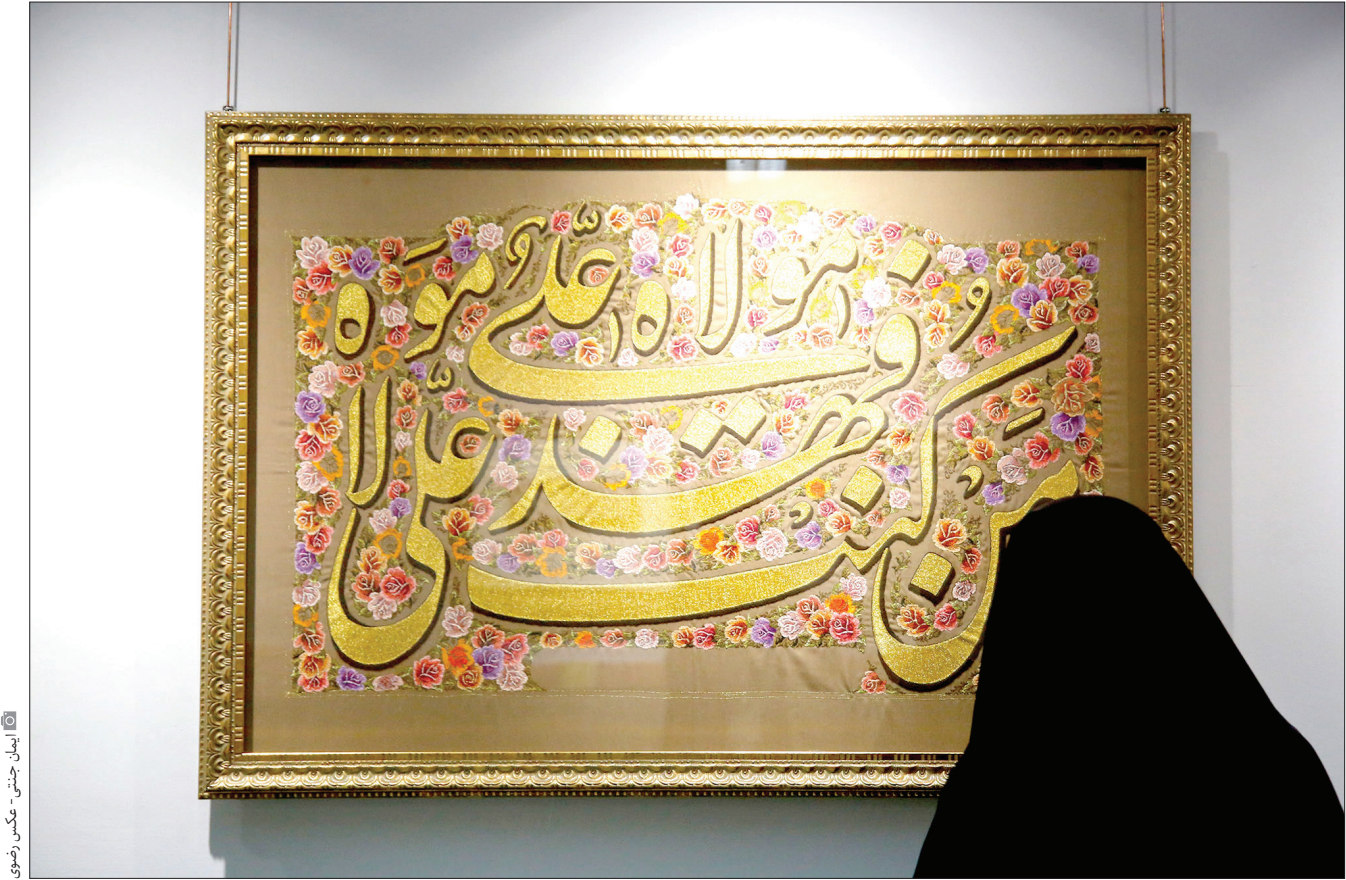
ایمان چینی

سندی که نحوه تعامل با مستأجران املاک زراعی آستان قدس رضوی را نشان می‌دهد