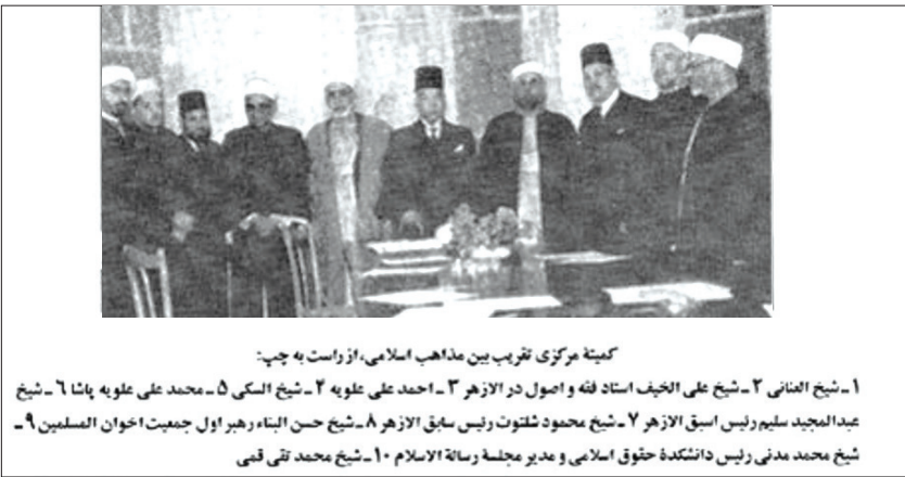
کمیته مرکزی تقرب بین مذاهب اسلامی، از راست به چپ:

متأسفانه دارالتقرب با وجود شروع خوب و مؤثر نتوانست به مسیر خود ادامه دهد. دلیل این مسئله، جدا از رحلت بنیان‌گذاران دارالتقرب،