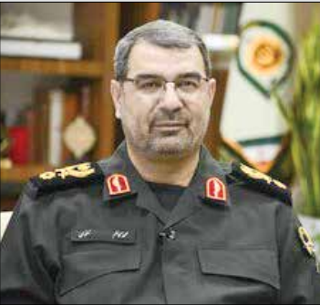
رئیس پلیس خراسان رضوی