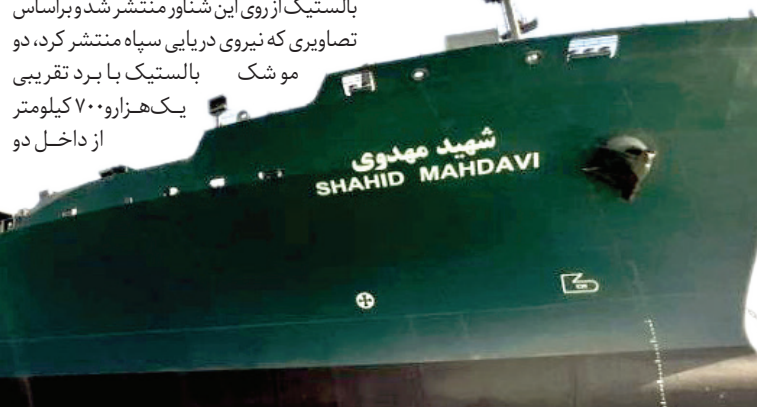
کشتی ناو شهید مهدوی

ناو شهید مهدوی که در اسفند ۱۴۰۱ به نیروی دریایی سپاه ملحق شده، بیش از ۲ هزار و ۱۰۰ تن وزن دارد، طول آن ۲۴۰ متر و عرض آن ۲۷ متر است. برد عملیاتی این شناور بیش از ۱۸ هزار مایل عنوان شده است.