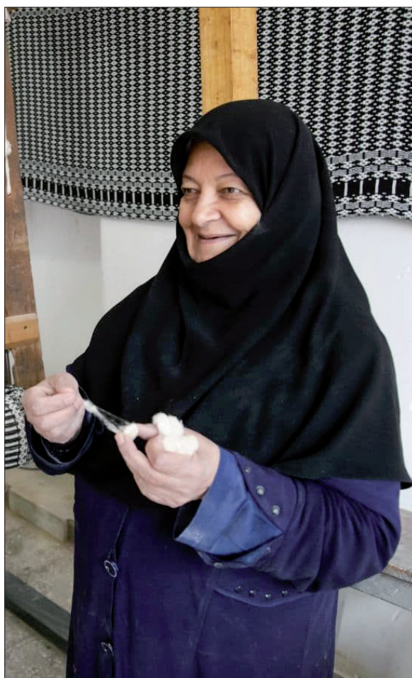
نخ‌ریسی هم جزئی از احرامی بافی بوده است