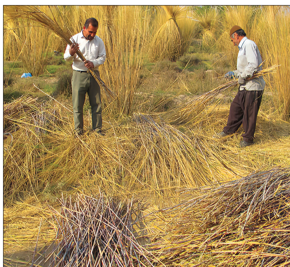
کاشت و داشت بوته‌های قلم‌نی، پیش از این‌ها در دزفول، رواج بیشتری داشته است