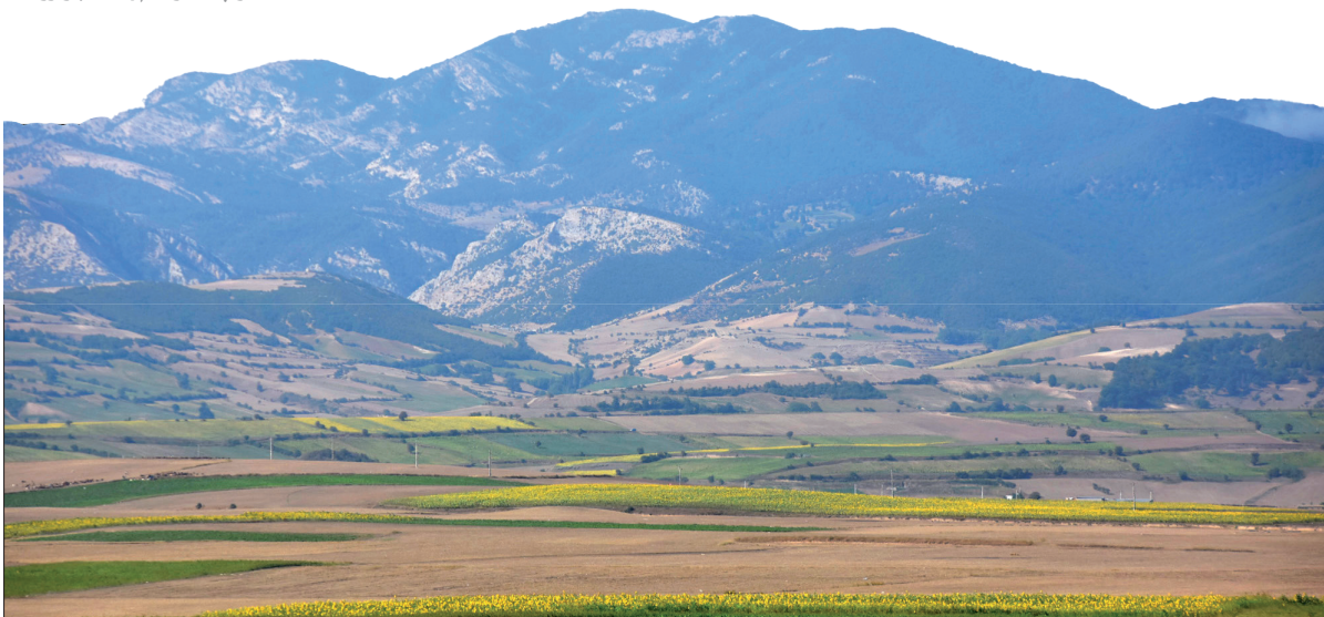
تخمه آفتابگردان یکی از دانه‌های روغنی پر کاربرد است