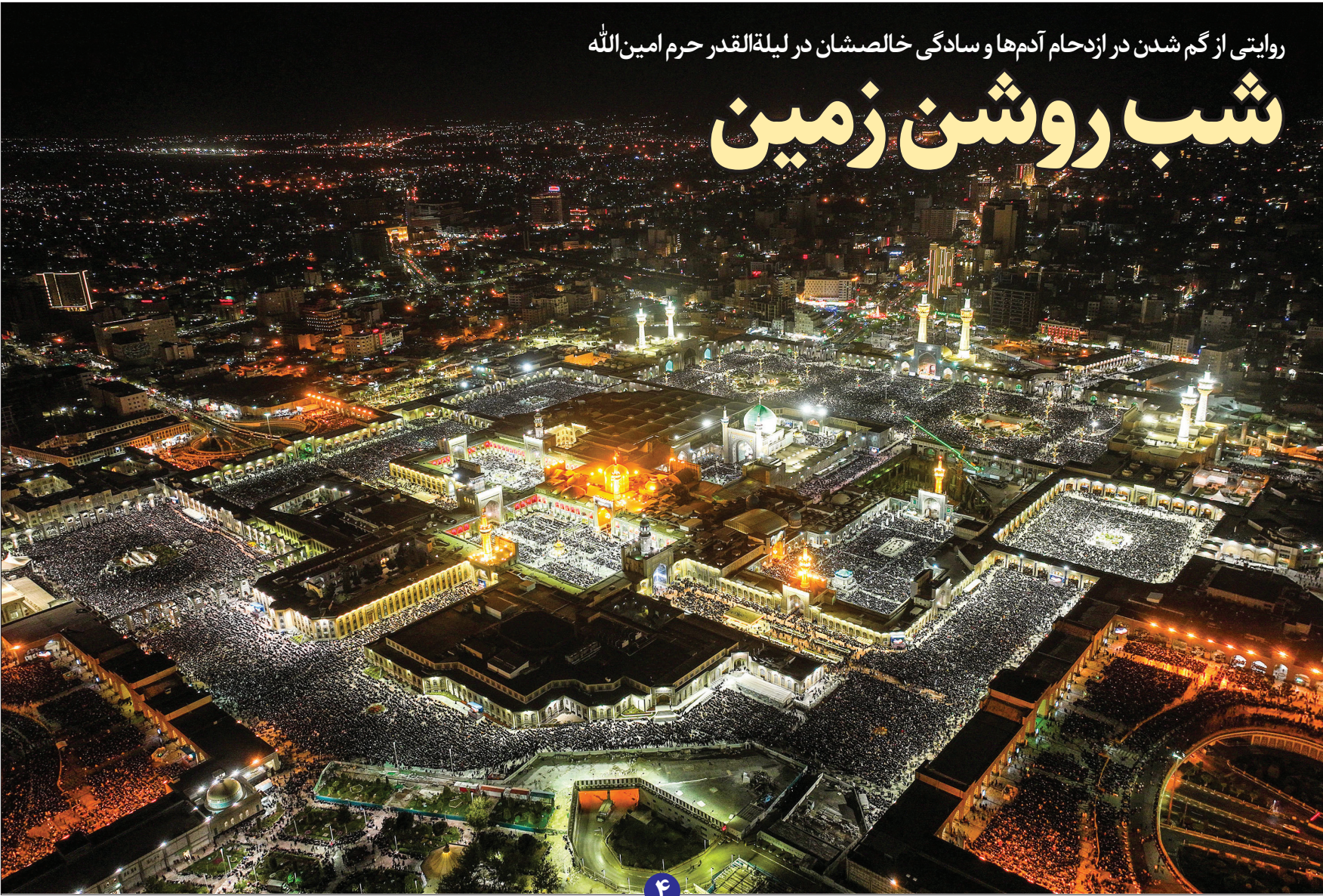
مصطفی شهبازی - آستان‌نیوز