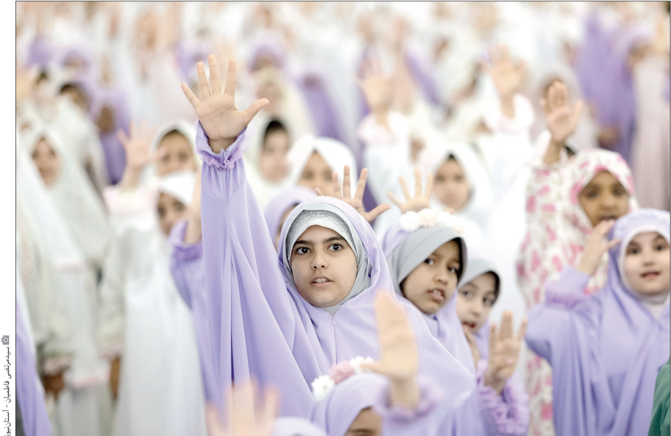
سیدمرتضی قاضیان - آستان‌نیوز