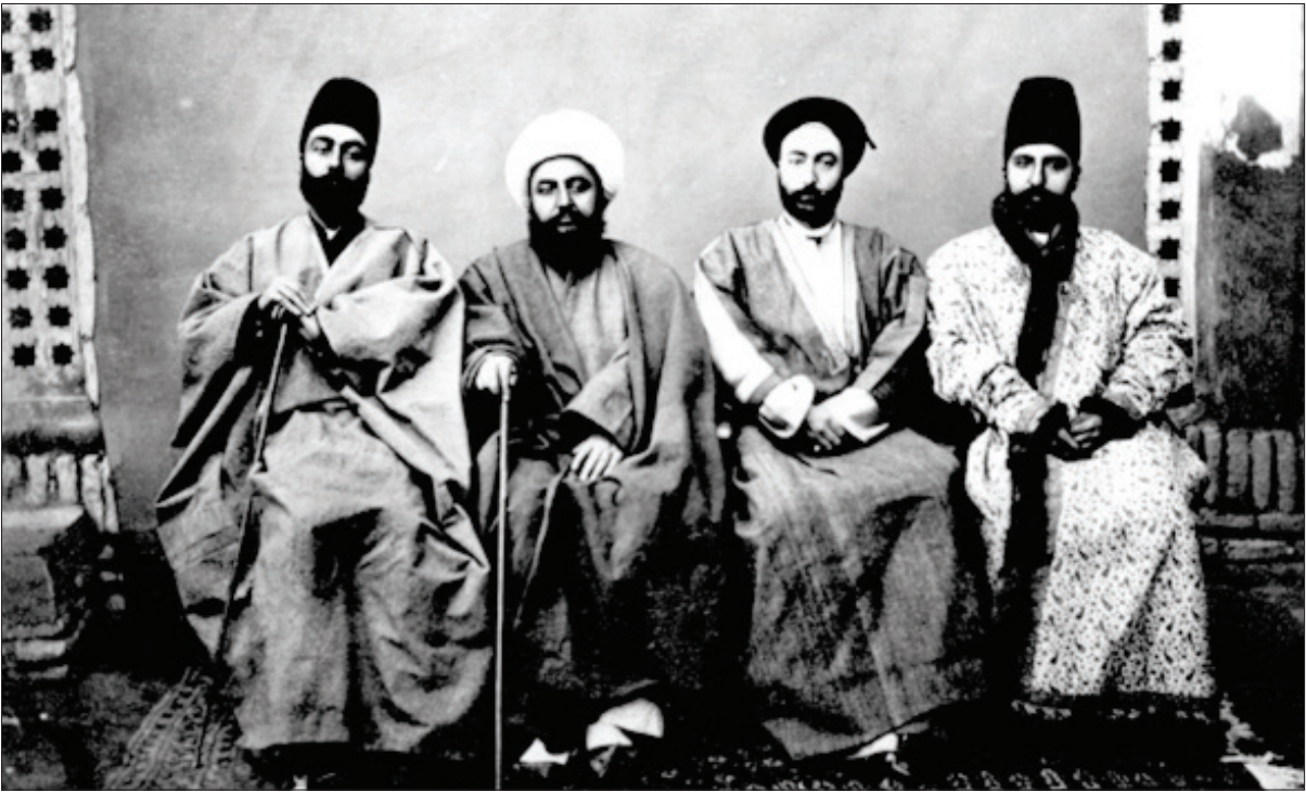
عکس گروهی از رجال و کارکنان آستان قدس در دوره قاجار

به نام ضابط اسناد، مسئول نگهداری اسناد و وقف‌نامه‌ها در حرم مطهر بوده است. برای همین هم امروزه، قدیمی‌ترین آرشيو در سطح ایران در آستان قدس رضوی قرار دارد. حجم انبوه اسناد قدیمی سبب شد در سال ۱۳۷۶ شمسی به همت مدیران وقت آستان قدس رضوی، اداره اسناد آستان قدس در کتابخانه مرکزی این نهاد مقدس تشکیل شود و امروزه این مرکز با نگهداری بیش از ۱۳ میلیون برگ سند، از غنی‌ترین آرشيوهای کشور و جهان اسلام به شمار می‌رود.