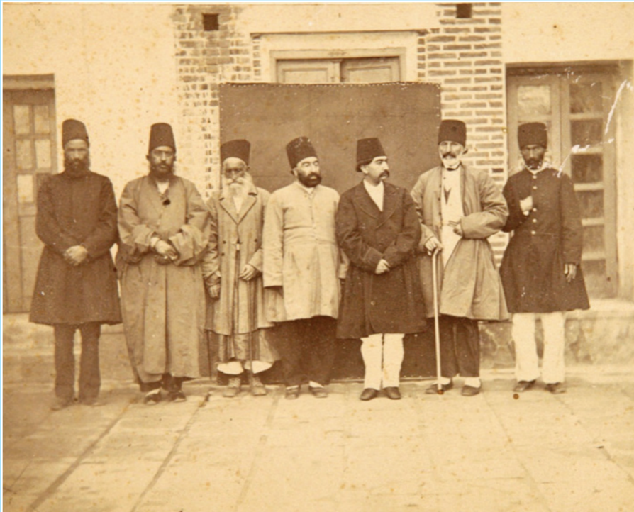
عکس ناصرالدین شاه قاجار و همراهان در اسناد آستان قدس رضوی (نفر دوم سمت چپ امیرکبیر است و نفر پنجم سمت چپ ناصرالدین شاه)