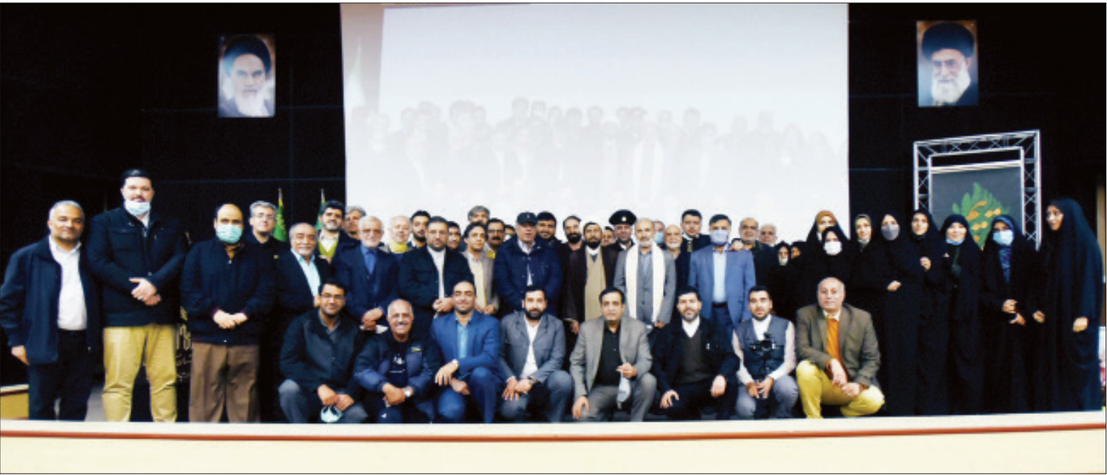
مراسم بزرگداشت مسعود نوذری- حسین کامران

و معماری ممتازی دارد و از لحاظ فیزیکی هم نزدیک ترین مکان به آرامگاه حضرت است و طبیعتاً جذابیت های بصری دارد.