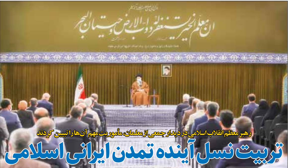
رهبر معظم انقلاب اسلامی در دیدار جمعی از علمایان، مأموریت مهم آن‌ها را تبیین کردند

حقوق بگیران حداقلی و درصدی هم مصرف کنندگان دانه هستند بر داشته خواهند شد. وزارت بهداشت به این مورد بیش از حد مهم توجه و نظر ویژه داشته باشد. حقوق را افزایش دادند چه شد، فقط کارگران