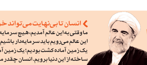
موضع‌ه آیت‌الله جواد دان

حجت الاسلام والمسلمین بهشتی در مراسم رونمایی از کتاب «درآمدی بر قرآن پژوهی» اثر سیدمجتبی حسینی که روز دوشنبه در مجتمع فرهنگی زیتون برگزار شد با طرح این پرسشی که انتظارات قرآن از ما چیست، گفت: قرآن ۱۰ انتظار از ما دارد، سه انتظار نسبت به خواندن قرآن یعنی انتظار اول قرأت، دوم تلاوت و انتظار سوم ترتیل است. قرأنت، صرف خواندن است،تلاوت،خواندن قرآن با نظمی است که در اختیار