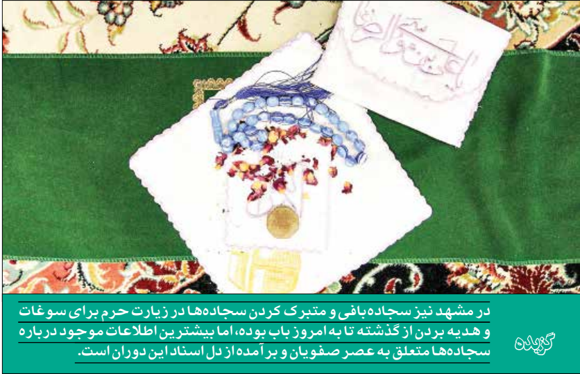
در مشهد نیز سجاده‌بافی و متبرک کردن سجاده‌ها در زیارت حرم برای سوغات و هدیه بردن از گذشته تا به امروز باب بوده، اما بیشترین اطلاعات موجود درباره سجاده‌ها متعلق به عصر صفویان و برآمده از دل اسناد این دوران است.