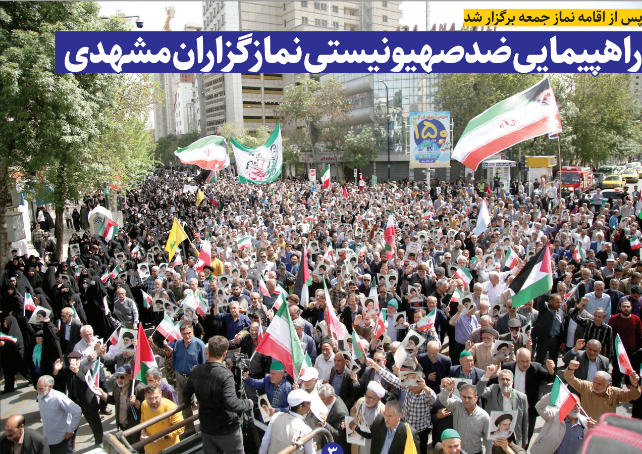
علی اکبر دشتی‌نور

امام جمعه مشهددر خطبه‌های نماز جمعه در حرم مطهر رضوی: