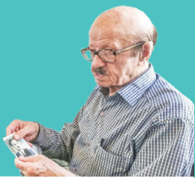
موعظه / شیخ جعفر ناصری