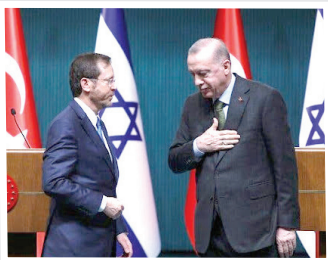
در جریان دیدار در تل‌آویو، نخست‌وزیر اسرائیل بنیامین نتانیاهو و رئیس‌جمهور ترکیه رجب طیب اردوغان.

رئیس جمهور ترکیه روز جمعه از تعلیق تمام مبادلات تجاری ۹/۵ میلیارد دلاری کشورش با رژیم صهیونیستی خبر داد. «رجب طیب اردوغان» در این باره گفت: اسرائیل ناکنون ۴۰ تا ۴۵هزار فلسطینی را با وحشیگری تمام به قتل رسانده است و منطقی نیست ما به‌عنوان قتل‌رسانده است و منطقی نیست ما به‌عنوان مسلمان در برابر اتفاقاتی که می‌افتد دست‌بسته بمانیم. آنکارا در ماه آوریل هم اعلام کرد تا زمان اعلام آتش‌بس در نوار غزه، صادرات ۵۴ محصول خود را به اسرائیل محدود خواهد کرد. با این حال برخی با توجه به پیشینه آنکارا تعلیق روابط تجاری ترکیه با رژیم صهیونیستی را تبلیغات و بازی سیاسی اردوغان برای جذب افکار عمومی داخلی و در جهان اسلام می‌دانند. بر اساس آنچه منابع آگاه می‌گویند کالاهایی که پیش از این به فلسطین اشغالی صادر می‌شدند، از این به بعد