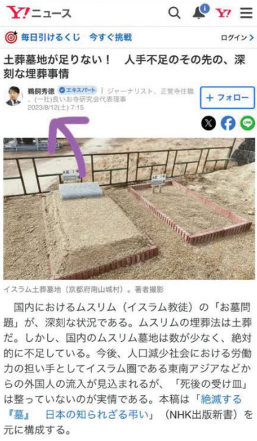
یسلازم تاسلام (کسولم کسولم) - ۱۱۱۱۱۱۱۱

باتلاق غزه گرفتار شده است. گرفتاری اشغالگران تنها مربوط به ناکامی نظامی نیست، بلکه در حوزه سیاسی، کشیده شدن رژیم به دیوان بین‌المللی دادگستری و احتمال اعلام حکم جلب سران صهیونیست توسط دادگاه، قطع یا کاهش رابطه دروغ به همراه چند عکس فتوشاپی در شرایط حساس جهان اسلام قطعاً فتنه‌انگیزی است. با توجه به حساسیت مسئله، به‌نظر می‌رسد موضوع یک سناریو تفرقه‌افکنانه و ایجاد حساسیت میان مذاهب شیعه و اهل تسنن باشد، آن‌هم در کشوری که مسلمانان از هر مذهب برای مدت‌ها به‌صورت مسالمت‌آمیز در کنار یکدیگر زیست فرهنگی داشته، دارند و با حضور در مساجد و مراسم مذهبی یکدیگر، اتحاد خوبی را نشان داده‌اند. در یک بعد احتمال می‌رود خبر مذکور برای برانگیختن احساسات شیعیان، به‌خصوص شیعیان پاکستانی برای ایجاد تحرک ایشان منتشر شده باشد، با این نیت که در ادامه دولت ژاپن مجبور به واکنش شده و محدودیت بر فعالیت‌های شیعیان (و حتی اهل سنت مقیم ژاپن که عموماً با شیعیان در فعالیت‌های اجتماعی و اسلامی و حمایت از فلسطین همکاری می‌کنند) قائل شود. ضمن اینکه ژاپن از دید ایرانی‌ها کشوری مورد توجه و قابل احترام بوده و بخشی از انتشار این خبر هم احتمالاً جامعه فارسی‌زبان را هدف قرار داده است. از سوی دیگر همه می‌دانیم این روزها رژیم صهیونیستی اوضاع خوبی ندارد و تا خرخره در