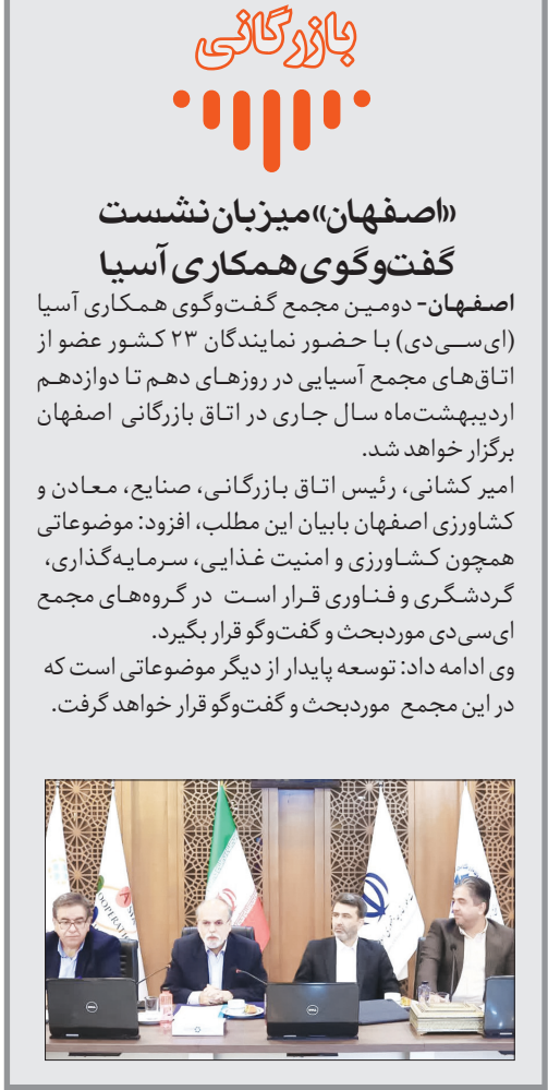
معاونان وزیر امور خارجه در جلسه‌ای در تهران.