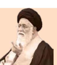
پیشینه — WWW.QUDSONLINE.IR — 3