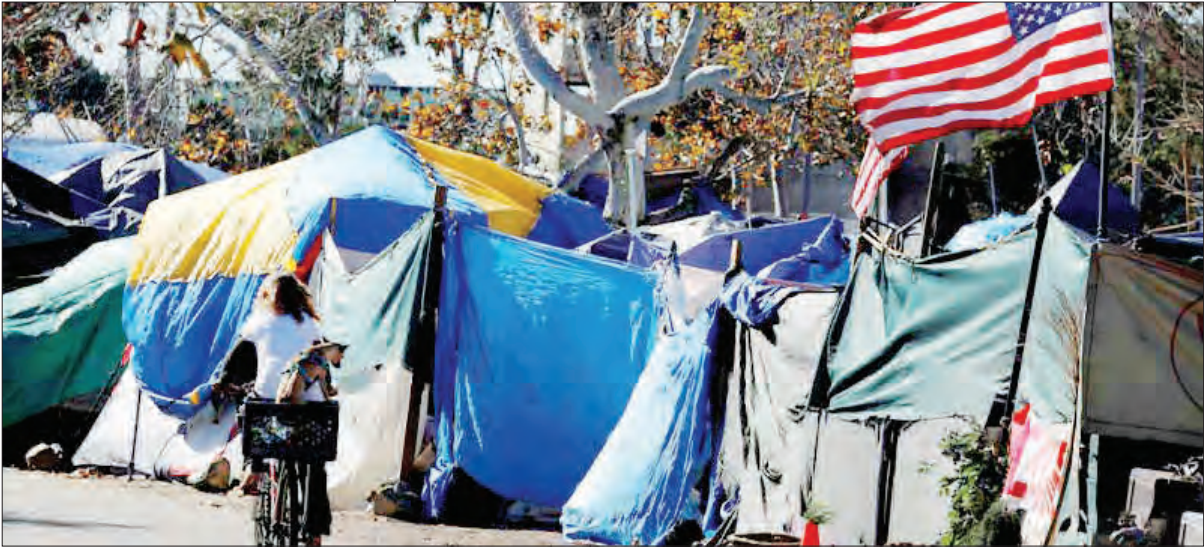
تظاهرات در مقابل کاخ سفید در واشنگتن، ۲۰۲۱